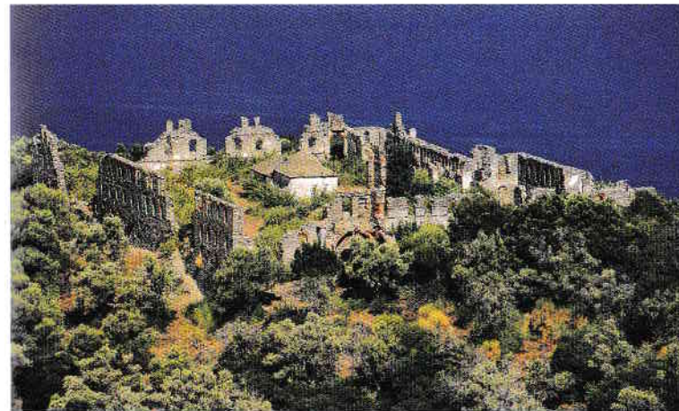
Fig. 4. Vechea școală Athoniada. Vedere generală.