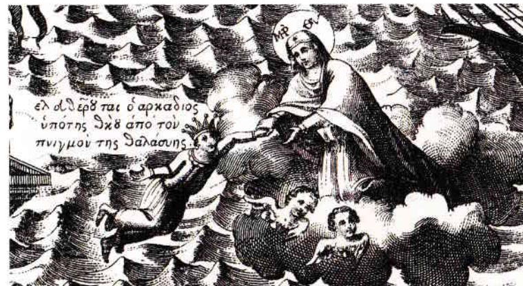
Fig. 2. Maica Domnului salvându-l pe Arcadie. Detaliu de gravură (1792).

Conform tradiției athonite, mănăstirea a fost construită de împăratul Constantin cel Mare (324-337) și distrusă ulterior de Iulian Apostatul (361-363). Mai apoi este reînțelemeiată în a doua jumătate a secolului al IV-lea de împăratul Teodosie cel Mare (379-395), în semn de recunoștință față de Maica Domnului, pentru izbăvirea minunată a fiului său (Arcadie), care fusese luat de valurile mării furtunoase în dreptul Muntelui Athos. Arcadie a fost atunci adus în chip minunat la țărm, unde marinarii l-au găsit dormind lângă un tufiș (gr. βάλτος). Din această cauză mănăstirea a fost numită Vatoped (gr. Βατοπαίδιον): de la βάλτος ( vatos – tufă,